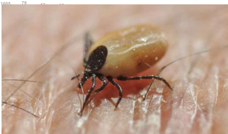
La maladie de Lyme se transmet majoritairement par les piqûres de tiques

La maladie de Lyme a été décrite pour la première fois il y a un peu plus de 30 ans, dans la région de Lyme aux États-Unis (Connecticut).